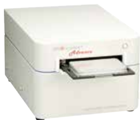
ウェルリダーアドバンス